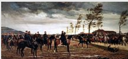
Conrad Freybergs Übergabe von Metz

Im September 1868 war in Spanien das Königshaus gestürzt worden, so dass das Übergangsregime einen neuen König suchte. Bismarck sorgte dafür, dass Leopold von