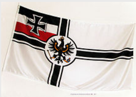
Kriegsflagge des Norddeutschen Bundes mit Schwarz-Weiß-Roth