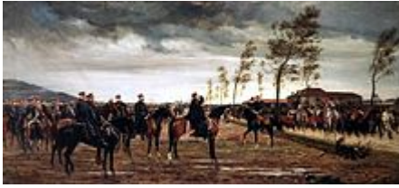
Conrad Freybergs Übergabe von Metz

Im September 1868 war in Spanien das Königshaus gestürzt worden, so dass das Übergangsregime einen neuen König suchte. Bismarck sorgte dafür, dass Leopold von Hohenzollern, ein Prinz aus dem süddeutschen Zweig der Hohenzollern, einer Kandidatur zustimmte. Als dies im Juli bekannt wurde, reagierte die öffentliche Meinung in Frankreich empört. Leopold zog seine Kandidatur zurück, und Frankreich hätte mit diesem diplomatischen Sieg zufrieden sein können. Napoleon III. beging aber den Fehler, vom Oberhaupt der Hohenzollerndynastie, dem preußischen König Wilhelm I., zu verlangen, eine solche Kandidatur für die Zukunft auszuschließen. Dies gab Bismarck in einer verkürzenden Darstellung, worin das französische Ansinnen und Wilhelms Ablehnung besonders schroff erschienen, an die Presse. Am 19. Juli erklärte Frankreich Preußen den Krieg.