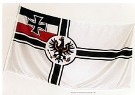
Kriegsflagge des Norddeutschen Bundes mit Schwarz-Weiß-Roth