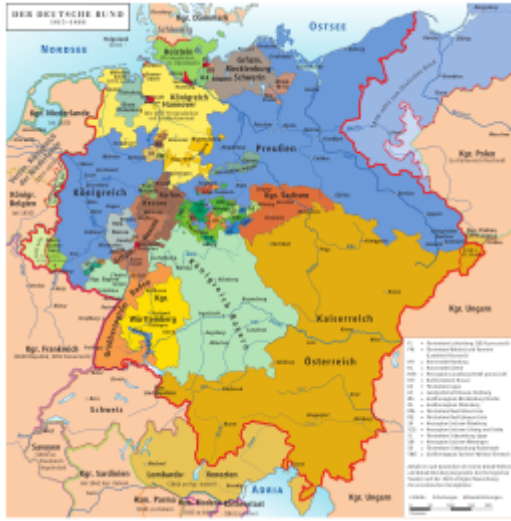
Deutscher Bund (rote Begrenzung)