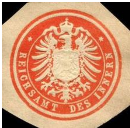
Siegelmarke Reichsamt des Innern

Das Reichsamt des Innern war die oberste Reichsbehörde im Deutschen Kaiserreich .