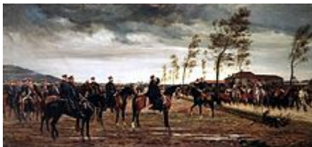
Conrad Freybergs Übergabe von Metz

Im September 1868 war in Spanien das Königshaus gestürzt worden, so dass das Übergangsregime einen neuen König suchte. Bismarck sorgte dafür, dass Leopold von Hohenzollern, ein Prinz aus dem süddeutschen Zweig der Hohenzollern, einer Kandidatur zustimmte. Als dies im Juli bekannt wurde, reagierte die öffentliche Meinung in Frankreich empört. Leopold zog seine Kandidatur zurück, und Frankreich hätte mit diesem diplomatischen Sieg zufrieden sein können. Napoleon III. beging aber den Fehler, vom Oberhaupt der Hohenzollerndynastie, dem preußischen König Wilhelm I., zu verlangen, eine solche Kandidatur für die Zukunft auszuschließen. Dies gab Bismarck in einer verkürzenden Darstellung, worin das französische Ansinnen und Wilhelms Ablehnung besonders schroff erschienen, an die Presse. Am 19. Juli erklärte Frankreich Preußen den Krieg.