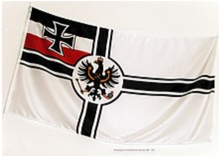
Kriegsflagge des Norddeutschen Bundes mit Schwarz-Weiß-Roth