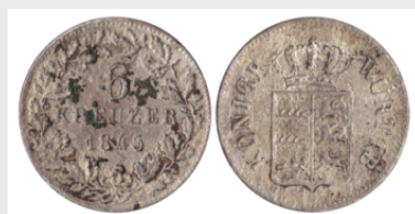
6 Kreuzer (1845)