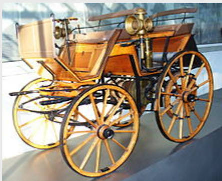
Daimlers Motorkutsche von 1886 (Modell)

konnte das Königreich Württemberg keinen großen Beitrag zur sich bald wieder entfaltenden Dynamik des von 1871 bis 1918 bestehenden deutschen Kaiserreichs leisten. Der Anteil der Württemberger an der Reichsbevölkerung ging von 4,4 Prozent im Jahre 1871 über 4,1 Prozent im Jahre 1891 auf 3,7 Prozent im Kriegsjahr 1916 zurück. Im Jahre 1913 betrug das durchschnittliche Einkommen je Einwohner in Württemberg 1.020 Mark, was nur etwa 88 Prozent des Durchschnittswerts im Reich war. Der noch immer sehr ländliche und kleinstädtische Charakter des Landes im Vorfeld des Ersten Weltkriegs ist auch aus den folgenden Zahlen ersichtlich.