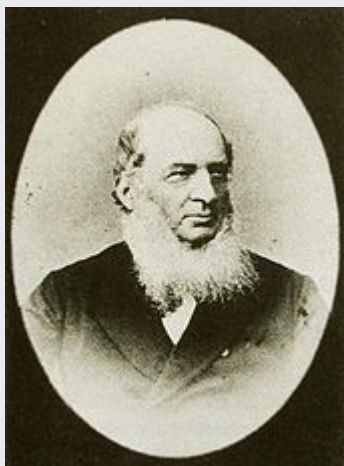
Karl von Varnbüler war von 1864 bis 1870 leitender Minister

Im August 1849 fanden in Württemberg Wahlen zu einer Verfassunggebenden Versammlung statt, bei denen die Demokraten gegenüber den gemäßigten Liberalen die Mehrheit erreichten. Während die Liberalen die Bindung des aktiven und passiven Wahlrechts an Einkommenshöhe und Vermögen forderten, verlangten die Demokraten ein allgemeines, gleiches und direktes Wahlrecht für alle volljährigen Männer. Ende Oktober 1849 entließ der König die von der Landesversammlung gewählte Regierung unter Friedrich Römer. Die Minister wurden durch beamtete Minister unter Johannes von Schlayer ersetzt. Als die Struktur und die Rechtsgrundlage des Beamtenministeriums durch die Landesversammlung abgelehnt wurden, löste Wilhelm I. sie auf. Zwei weitere Landesversammlungen im Jahr 1850, bei denen die Demokraten ebenfalls jeweils die Mehrheit hatten, wurden ebenfalls aufgelöst. Trotzdem etablierte sich in Württemberg auch danach eine starke liberale und demokratische Opposition.