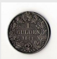
1 Gulden (1841),

Bis 1875 war die Währung des Königreichs Württemberg der Gulden . Ein Gulden bestand aus 60 Kreuzern . Nach der Gründung des Deutschen Reichs wurde durch das Deutsche Münzgesetz vom 9. Juli 1873 und durch die kaiserliche Verordnung vom 22. September 1875 die Goldmark mit Wirkung vom 1. Januar 1876 eingeführt. Der Gulden konnte noch fünf Jahre parallel verwendet werden. Der Umtauschkurs für einen württembergischen Gulden betrug 1,71 Mark für einen Gulden.