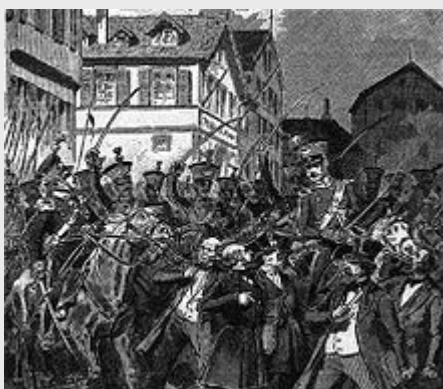
Die Auflösung des Rumpfparlaments durch württembergische Truppen –

Im April 1849 beschlossen die Regierung und der Landtag die Anerkennung der in der Frankfurter Paulskirche verabschiedeten Reichsverfassung , die einen gesamtdeutschen als kleindeutsche Lösung konzipierten Nationalstaat auf der Grundlage einer demokratisch verfassten konstitutionellen Monarchie vorsah. Wilhelm empfand diesen Beschluß zwar als Demütigung, war aber der einzige Monarch unter den 29 Landesfürsten des deutschen Bundes, die der von der Frankfurter Nationalversammlung verabschiedeten Verfassung zustimmten – die Könige von Preußen, Bayern, Sachsen, Hannover sowie der österreichische Kaiser Ferdinand I. lehnten sie ab.