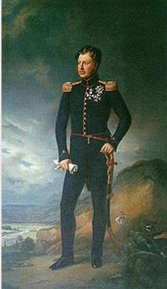
König Wilhelm I. 1822 nach einem Gemälde von Joseph Karl Stieler

Das Verhältnis zwischen König Friedrich und seinem Sohn Wilhelm Friedrich Karl , dem späteren König Wilhelm I., war sowohl persönlich als auch politisch von starken Spannungen geprägt. So war es nur folgerichtig, daß der neue König nicht mit dem Namen seines Vaters, sondern mit dem Namen Wilhelm seine Regentschaft antrat und einen umfassenden Politikwechsel einleitete.