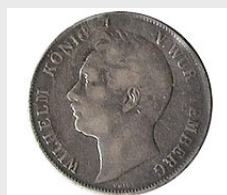
1 Gulden (1841), rückseitig