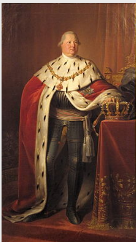
Bildnis König Friedrichs I. von Württemberg im Krönungsornat und Rüstung,

festlegte. Herzog Friedrich wurde zum Kurfürst erhoben. Zahlreiche kleine Herrschaften wurden mediatisiert und unter der Bezeichnung Neuwürttemberg dem neuen Kurfürstentum zugeschlagen. Dazu gehörten die mediatisierten Reichsstädte Aalen, Giengen an der Brenz, Heilbronn, Rottweil, Esslingen am Neckar, Reutlingen, Schwäbisch Gmünd, Schwäbisch Hall und Weil der Stadt sowie folgende säkularisierte kirchliche Besitzungen: die Fürstpropstei Ellwangen , die Reichsabtei Zwiefalten , das Ritterstift Comburg , das Kloster Heiligkreuztal bei Riedlingen , das Kloster Schöntal , das Kloster Margrethausen , das Stift Oberstenfeld und der stift-murische Teil des Dorfes Dürrenmettstetten. Diese Zugewinne entsprachen in Summe etwa einer Fläche von 1609 Quadratkilometern mit 110.000 Einwohnern und 700.000 Gulden Steueraufkommen. Dem standen etwa 388 Quadratkilometer linksrheinisch verlorenes Gebiet mit zirka 14.000 Bewohnern und zirka 250.000 Gulden an Staatseinkünften gegenüber. Mit dem Aufbau der Verwaltung Neuwürttembergs betraut war der Minister Normann-Ehrenfels .