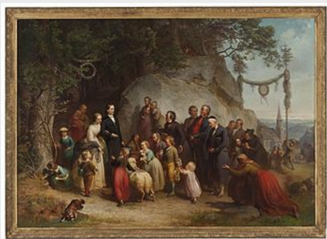
Empfang eines neuen Pfarrers durch seine Gemeinde im

Äußere Zeichen des Pietismus waren die als Tugenden beschworenen Prinzipien von Ordnung, Pflichtbewußtsein und Fleiß . Die diesem Teil der württembergischen Bevölkerung nachgesagten Eigenschaften wie Sparsamkeit, Beharrlichkeit, Zähigkeit und Arbeitsamkeit waren oft begleitet von einer landesüblichen beinahe sprichwörtlichen Schroffheit und Reserviertheit. Allzu große Höflichkeit erweckte Argwohn. Ausgelassenheit, Protz und Pomp wurden abgelehnt, so daß die schönen Künste in Altwürttemberg von jeher einen schweren Stand hatten.