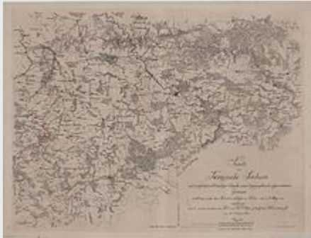
Grenzen des Königreichs Sachsen nach dem Wiener Kongreß