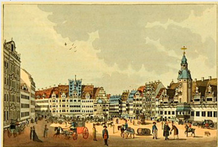
Der Markt aus der Petersstraße , Leipzig 1804