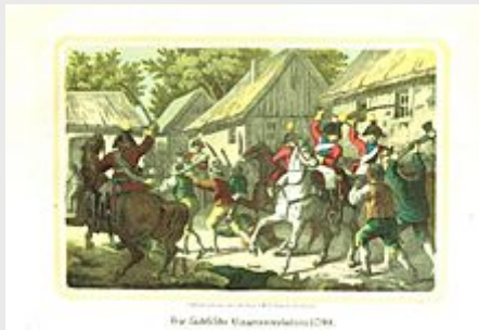
Die sächsische Bauernrevolution 1790

Der Vorläuferstaat des Königreichs war das Kurfürstentum Sachsen. Dieses hatte sich seit Ausgang des Mittelalters zu einem komplexen Territorialkomplex in der Mitte Deutschlands entwickelt. Es gehörte bis zu den Schlesischen Kriegen zu den bedeutendsten protestantischen Staaten des Heiligen Römischen Reichs, wurde dann aber vom nördlichen Anrainer Brandenburg-Preußen verdrängt. Die politische Bedeutung Sachsens war nach 1763 deutlich geschrumpft. Dafür florierte die Wirtschaft und eine hoch entwickelte Städte- und Gewerblandschaft prägte den prosperierenden Kurstaat zum Ausgang des 18. Jahrhunderts.